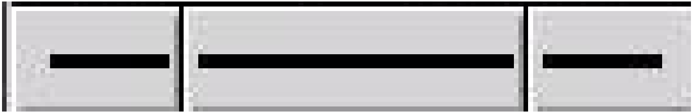
Figure 3.2: Właściwości linii

Linie mogą być w prosty sposób modyfikowane w celu tworzenia elementów jak np. strzałki. Na dole skrzynki narzędziowej znajdują się 3 przyciski z symbolami linii. Kliknięcie i przytrzymanie spowoduje otwarcie menu demonstrującego wygląd linii.